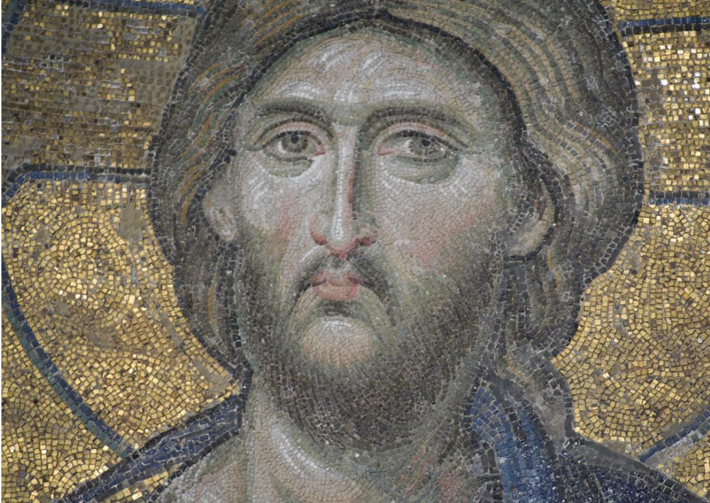
Mozaiek Jezus in de Aya Sophia te Istanboel, Turkije

Voor meer informatie zie de website: http://www.apgen.nl/